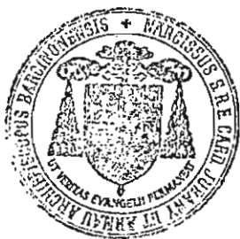
Narcís Jubany Cardenal-Arquebisbe de Barcelona

Ho decreta i firma l'Emm. i Rvdm. Sr. Cardenal-Arquebisbe de Barcelona.